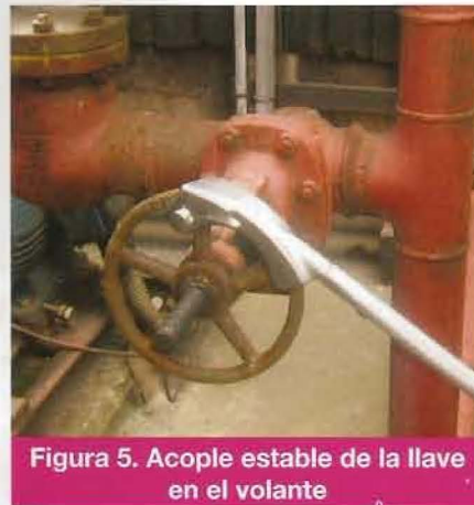
Figura 5. Acople estable de la llave en el volante

Para el diseño de la zona de agarre, se han tenido en cuenta las medidas antropométricas referentes al agarre palmar, de los dedos y de las manos sobre el percentil 95 de la población española (Fuente: Ministerio de Trabajo y Asuntos Sociales) permitiendo su uso con guantes de trabajo. Además, la presencia de la empuñadura es incompatible con el uso de tubos de extensión del brazo de palanca.