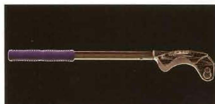
Figura 7. La llave presenta un diseño muy novedoso