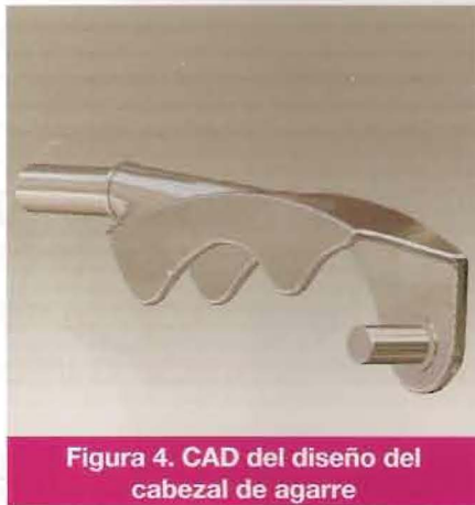
Figura 4. CAD del diseño del cabezal de agarre