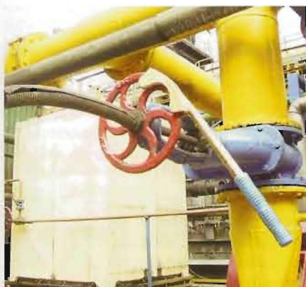
Figura 6. La llave facilita de forma evidente la maniobra de las válvulas

✓ Obligaciones normativas y legales relativas a los materiales a utilizar y a las características de rigidez estructural, seguridad y comodidad en el manejo manual.