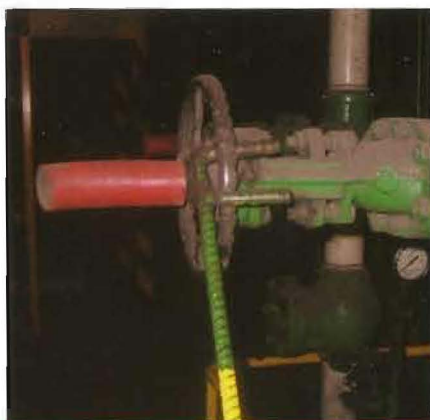
Figura 1. Útil empleado en la apertura y cierre de válvulas de volante

La empuñadura ergonómica, asegura su firme agarre al poder ser cubierto por la totalidad de la superficie de la mano, lo que evita los peligrosos resbalamientos.