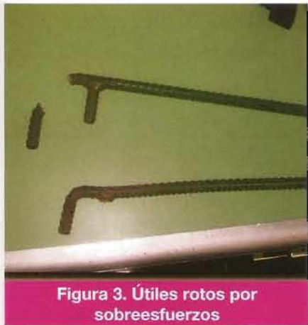
Figura 3. Útiles rotos por sobreesfuerzos